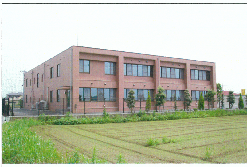
葛西用水路土地改良区事務所